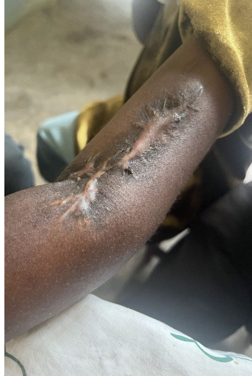
Cicatrice d'un garçon de 12 ans qui a été touché au bras par des tirs de combattants du M23 dans sa maison dans le quartier de Kasenga à Uvira, le 10 décembre 2025. Le garçon a aussi été poignardé à la jambe avec une baïonnette.

Les combattants du M23 et les soldats rwandais ont tué quatre frères, âgés de 23, 21, 20 et 16 ans, vers 10 heures du matin le 10 décembre, également à Kasenga. 44 Leur père, qui se cachait dans la pièce voisine, a raconté que les assaillants ont accusé les quatre frères