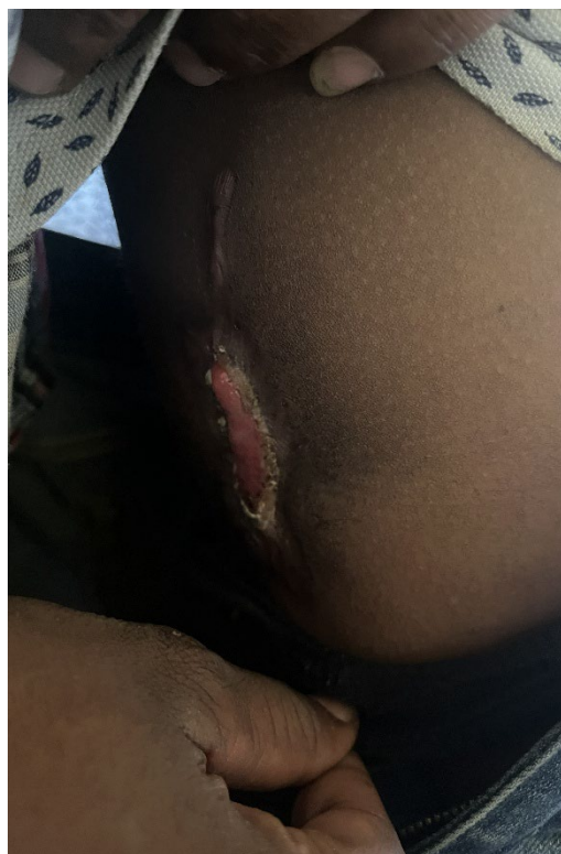
Cicatrice d'un homme touché au ventre par des tirs de combattants du M23 le 10 décembre 2025, dans sa maison, dans le quartier de Kasenga à Uvira. L'homme, qui avait été laissé pour mort, a aussi été touché par des tirs à la cuisse.

Ce jour-là, le M23 et les forces rwandaises sont entrés dans la ville et ont commencé à tirer sans discernement sur les hommes et les garçons. Un vendeur de téléphone âgé de 28 ans a raconté qu'il était en train de fermer son kiosque lorsque des combattants du M23 sont