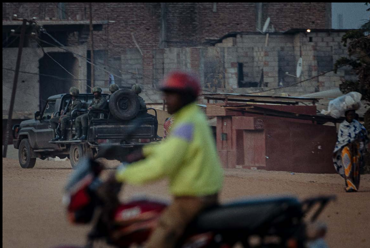
Le groupe armé M23 en patrouille à Uvira, en République démocratique du Congo, le 13 décembre 2025.

En vertu du droit international, le contrôle global exercé par le Rwanda sur le groupe armé M23 et son contrôle effectif des régions des provinces du Nord-Kivu et du Sud-Kivu, y compris Uvira, ont fait du Rwanda une puissance occupante. La nature systématique de bon nombre de ces abus révèle l'implication de commandants du M23 et de responsables militaires rwandais, et leur possible responsabilité légale pour crimes de guerre. Human Rights Watch appelle les gouvernements rwandais et congolais ainsi que les tribunaux régionaux et internationaux à enquêter sur ces exactions et à traduire les responsables en justice, y compris au titre de la responsabilité du commandement.