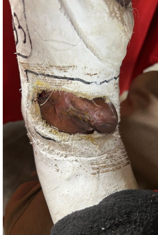
Blessures au coude d’un homme qui a été touché par des tirs de combattants du M23 dans le quartier de Kasenga à Uvira le 10 décembre 2025, alors qu’il tentait de fuir la ville.

Après être entrés dans Uvira le 10 décembre, le M23 et les forces rwandaises ont également tiré illégalement sur des civils qui tentaient de fuir pour se mettre à l’abri. Human Rights Watch a documenté onze cas de personnes qui ont essuyé des tirs – dont 9 ont été tuées – alors qu’elles s’enfuyaient vers la frontière burundaise, à seulement trois à cinq kilomètres au nord de la ville, ou vers les collines surplombant Uvira. 33 Des témoins ont décrit le chaos et la peur, avec des familles prises au piège, incapables de trouver un passage sûr pour quitter la ville. 34