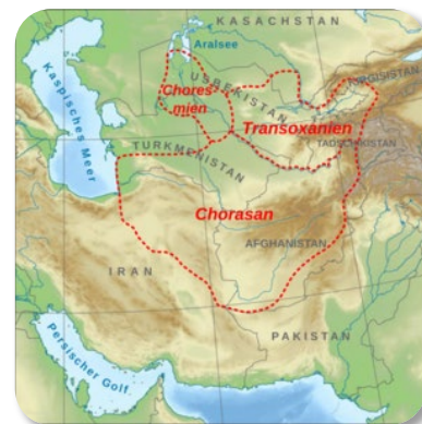
Abb. 2: Das historische Gebiet Khorasan

Zur Erstarkung des ISPK beigetragen hatte u.a., dass viele ISPK-Kämpfer durch den ISPK selbst, aber auch durch die Taliban aus Gefängnissen befreit wurden und dass nach der Machtübernahme nicht alle Taliban gleichermaßen am Gewinn beteiligt wurden und sich deshalb teilweise dem ISPK anschlossen. Auch Soldaten der ehemaligen afghanischen Armee waren zum ISPK übergelaufen, um die Taliban zu bekämpfen. 6 Die Taliban verfolgen den ISPK rigoros, da sie neben sich keinen Kontrahenten zu ihrem Machtanspruch dulden. Nach einer dreitägigen Kleriker-Versammlung in Kabul wurde der ISPK in einem Erlass am 02.07.2022 als „korrupte Sekte“ deklariert und der afghanischen Bevölkerung jeglicher Kontakt verboten. 7 Human Rights Watch berichtete am 07.07.2022, dass die Taliban in den Provinzen Kunar und Nangarhar ca. 100 Zivilisten, die vermeintliche Mitglieder und Unterstützer des ISPK gewesen sein sollen, getötet hatten. 8 Im Distrikt Manogi (Provinz Kunar) wurden laut Angaben lokaler Taliban zwei Mitglieder des ISPK im Juli 2025 durch die Taliban enthauptet. 9 Bei der Mehrheit der afghanischen Bevölkerung stößt die brutale Vorgehensweise des ISPK nach Jahrzehnten des Krieges nicht auf Akzeptanz.