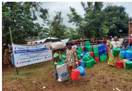
Distribution des articles ménagers sur l'axe Kongolo – Sola

Du 25 au 27 janvier 2022, la Croix rouge nationale, avec l'appui du Fonds des Nations Unies pour l'enfance (UNICEF), a appuyé environ 10 870 personnes déplacées en articles ménagers essentiels sur l'axe Kongolo – Sola, dans le Territoire de Kongolo (Tanganyika). Ces personnes déplacées avaient fui des attaques d'hommes armés dans le Territoire de Kabambare (province du Maniema), en novembre 2021.