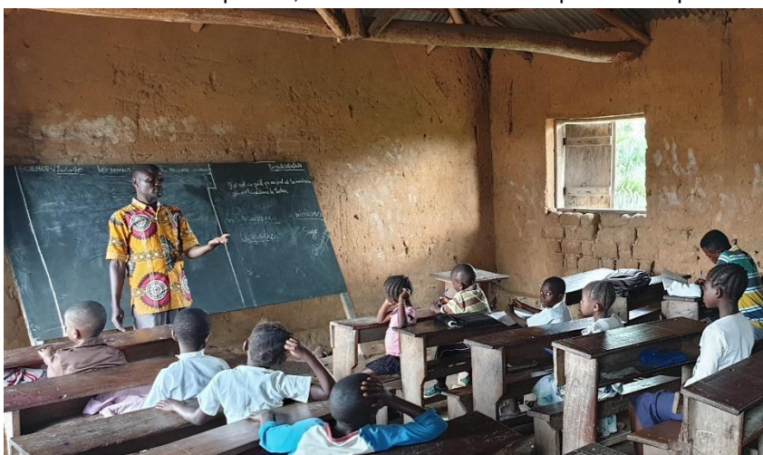
Des enfants déplacés contraints de parcourir de longues distances pour trouver une école

En réponse aux importants besoins en éducation des enfants déplacés, environ 25 000 enfants pourront reprendre le chemin de l'école à partir du mois d'octobre 2021 à travers divers projets financés par ECHO i , le Fonds humanitaire de la RDC et le gouvernement norvégien. L'ONG Norwegian Refugee Council distribuera des kits scolaires à plus de 9 500 enfants et facilitera la réintégration scolaire de 6 000 autres dans la zone de santé de Fataki (territoire de Djugu). L'ONG AVSI quant à elle, va assister 8 800 enfants dans les zones de santé de Mangala et Bambu à reprendre le chemin de l'école (Djugu) ; UNICEF apportera également un soutien à 20 000 autres dans les territoires de Djugu, d'Irumu et de Mambasa. Ce projet représente 34% de tous les enfants qui ont besoin de retourner à l'école.