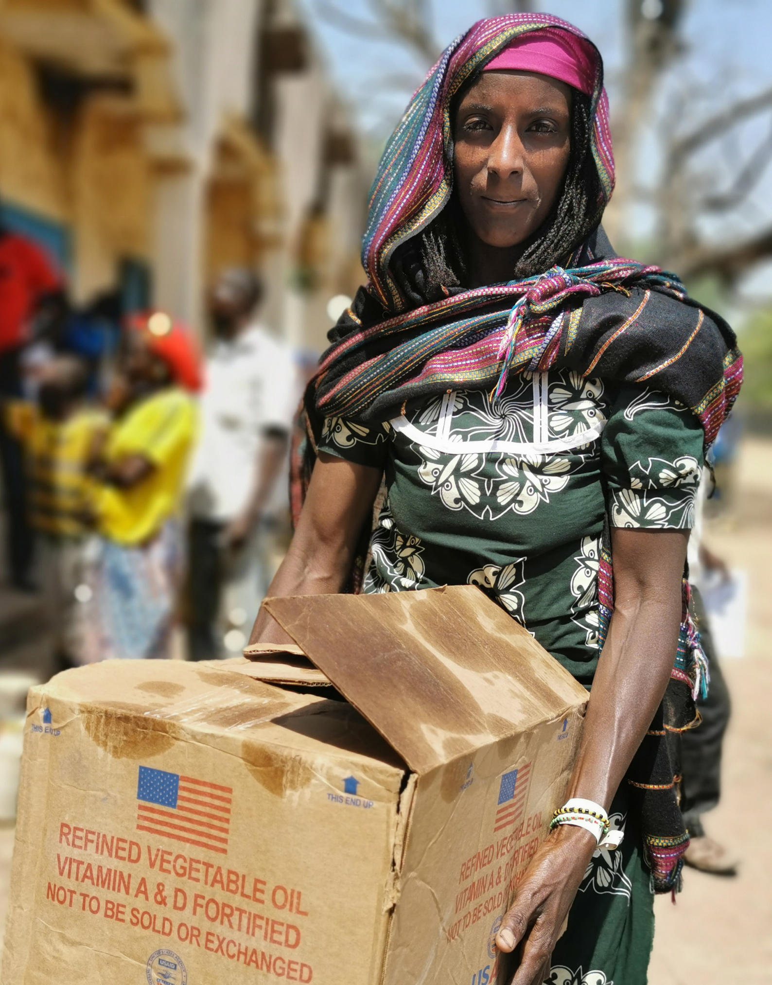
Les réfugiés nouvellement arrivés de la République centrafricaine reçoivent une aide alimentaire d'urgence.