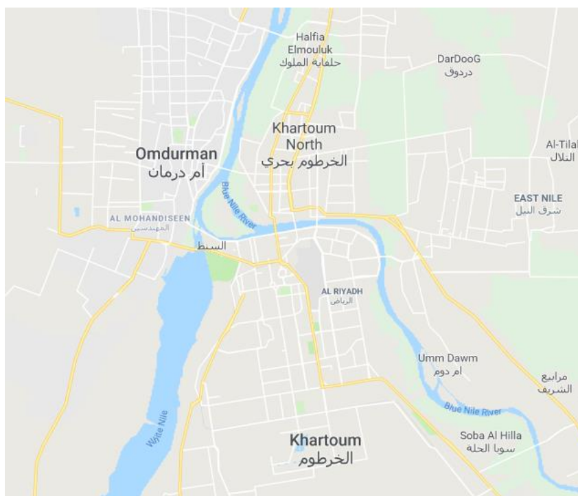
Figuur 1: Khartoum, Sudan (Google Maps) 4

De grootste stedelijke agglomeratie van Soedan bevindt zich rondom de hoofdstad Khartoem, aan de samenvloeiing van de Blauwe en de Witte Nijl, en behelst ook Noord-Khartoem (of Bahri), op de noordelijke oever van de Blauwe Nijl en de oostelijke oever van de Nijl, en Omdurman, op de westelijke oever van de Nijl. 3 In dit rapport verwijst Khartoem naar heel deze agglomeratie.