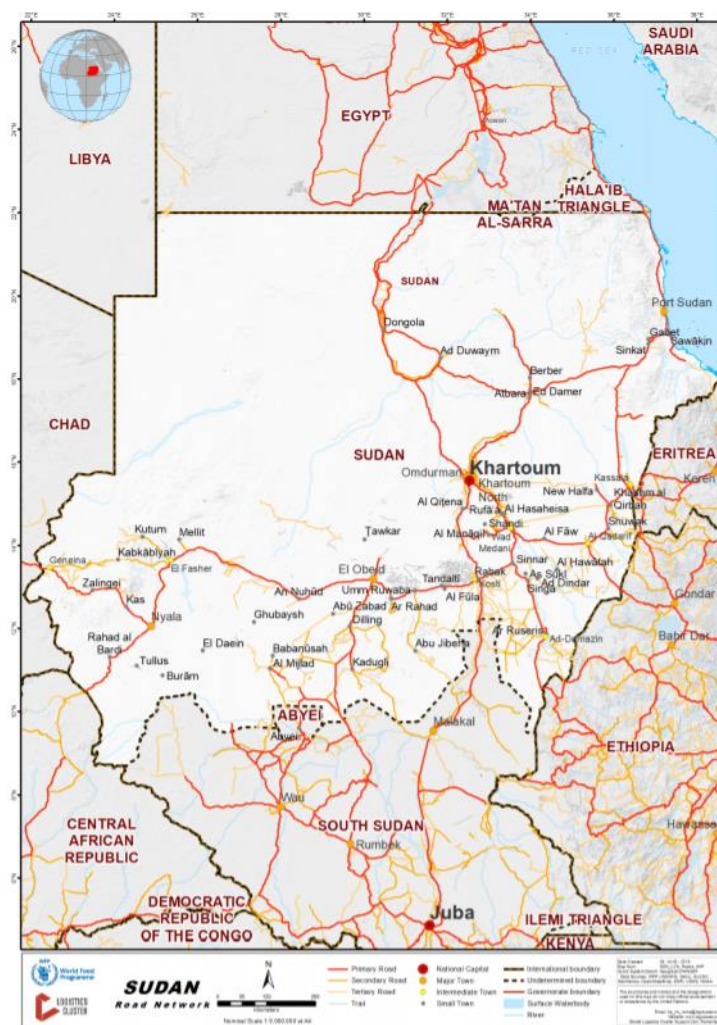
Figuur 3: Sudan Road Network (08/08/2018) 17

Onderstaande kaart toont het wegennetwerk in Soedan, en geeft de wegen weer die Khartoem via de stad El Obeid in Noord-Kordofan met verschillende plaatsen en steden in Darfoer verbindt. 16