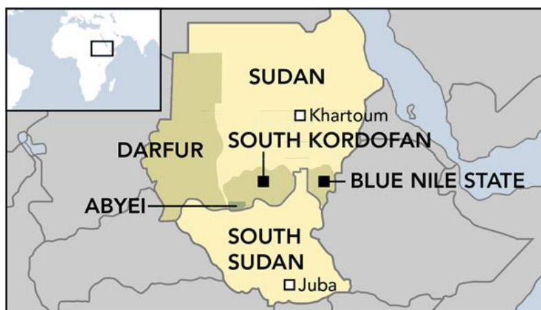
Figuur 2: Map of Darfur and the 'Two Areas', South Kordofan and Blue Nile 9

Dit onderzoek focust op personen afkomstig uit Darfoer, en meer specifiek personen behorend tot niet-Arabische of Afrikaanse gemeenschappen van Darfoer (verder Darfoeri), en op personen afkomstig uit de Two Areas, en meer specifiek personen afkomstig uit het Nuba-gebergte in Zuid-Kordofan behorend tot de Nuba. Volgende twee hoofdstukken bespreken kort de demografische situatie in Darfoer en de Two Areas.