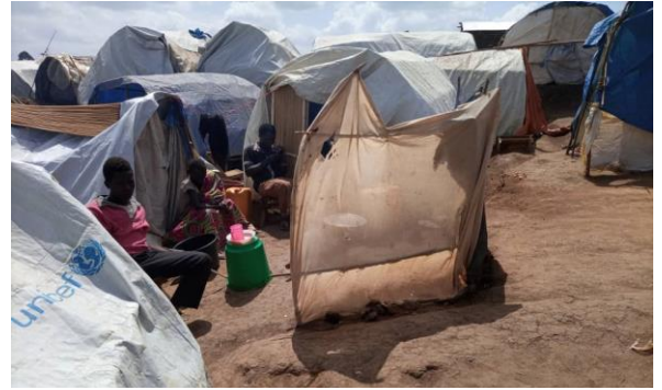
Des personnes déplacées récemment établis à Djaiba pour se mettre à l'abri de l'insécurité.

Près de 16 000 personnes déplacées, ayant trouvé refuge dans un site spontané à proximité d'une base de la MONUSCO à Djaiba et dans les localités environnantes, vivent dans des conditions très précaires. Ils présentent des besoins en vivres, articles ménagers essentiels (AME) et abris. Ils avaient fui des attaques des hommes armés à Fataki dans le territoire de Djugu depuis le 12 juin. Au moins deux établissements scolaires ont été pillés et détruits lors des attaques. Malgré l'accalmie observée à Fataki depuis le 22 juin, aucun mouvement de retour de populations ou d'acteurs humanitaires n'est signalé sur place.