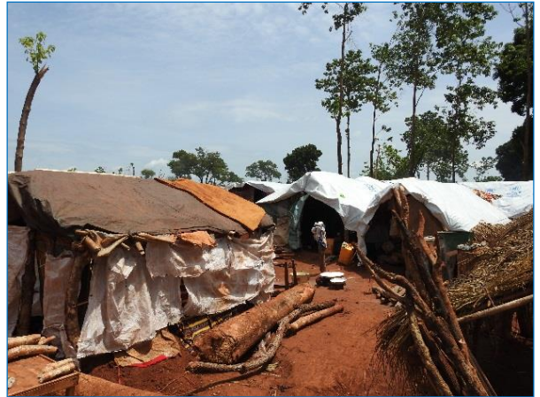
Bria. Préfecture de la Haute Kotto. Une vue du site de PK3.

Une réponse d'urgence a pu être apportée en termes de médicaments et d'autres intrants (remis par l'OMS et l'UNICEF) pour améliorer l'accès à l'eau, l'hygiène et l'assainissement à Nguédéré en faveur du centre de santé de Mingala, 7 Km au Nord-est. D'après les observations de la mission, les besoins les plus urgents sont la protection et la santé.