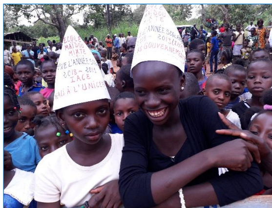
Bambari. Préfecture de la Ouaka, RCA. Après une fin d'année scolaire 2017-2018 perturbée par la violence, les enfants de Bambari ont repris le chemin de l'école.

Certains d'entre eux s'étaient rendus à l'école pendant toute la durée des grandes vacances, pour suivre des cours de rattrapage mis en place par les organisations partenaires de l'UNICEF. Mais le lundi 17 septembre, la rentrée des classes solennelle avait pour de nombreux enfants déplacés un parfum de victoire : commencer ou continuer à aller à l'école, lorsque l'on vit dans des conditions difficiles et que l'on a vécu de nombreux traumatismes, c'est retrouver un tout petit peu de normalité. C'est aussi pouvoir rêver à un avenir.