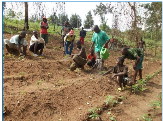
Berberati. Préfecture de la Mambéré Kadéï, RCA (3 septembre 2018). Au centre « Sara mbi gaz o », des enfants apprennent non seulement les activités agro-pastorales, mais ils font aussi de la musique.

Dans ce centre, il y a également des activités piscicoles. Les revenus générés par ces activités agropastorales et piscicoles contribuent à pérenniser les activités du centre. En plus, le centre organise des cours d'alphabétisation et des activités sportives et musicales.