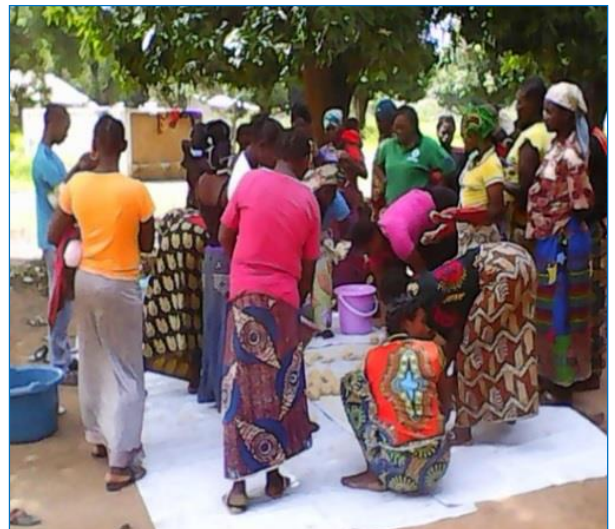
Batangafo. Préfecture de l'Ouham, Distribution de produits d'hygiène aux déplacés.

Le projet du Fonds humanitaire, axé sur la réhabilitation de ces ouvrages, a ainsi permis de maintenir propre et accessible dans le respect de la dignité des usagers, les douches et les latrines.