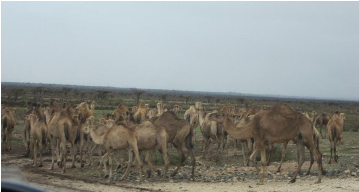
Kamelhold er en viktig næringsvei på Afrikas Horn. Her fra Somali-regionen i Etiopia på vei fra Jijiga til Wajale.

I Somali-regionen i Etiopia lever anslagsvis 86 prosent av befolkningen på landsbygda, og størstedelen er pastoralister (Jackson 2011, s. 13).