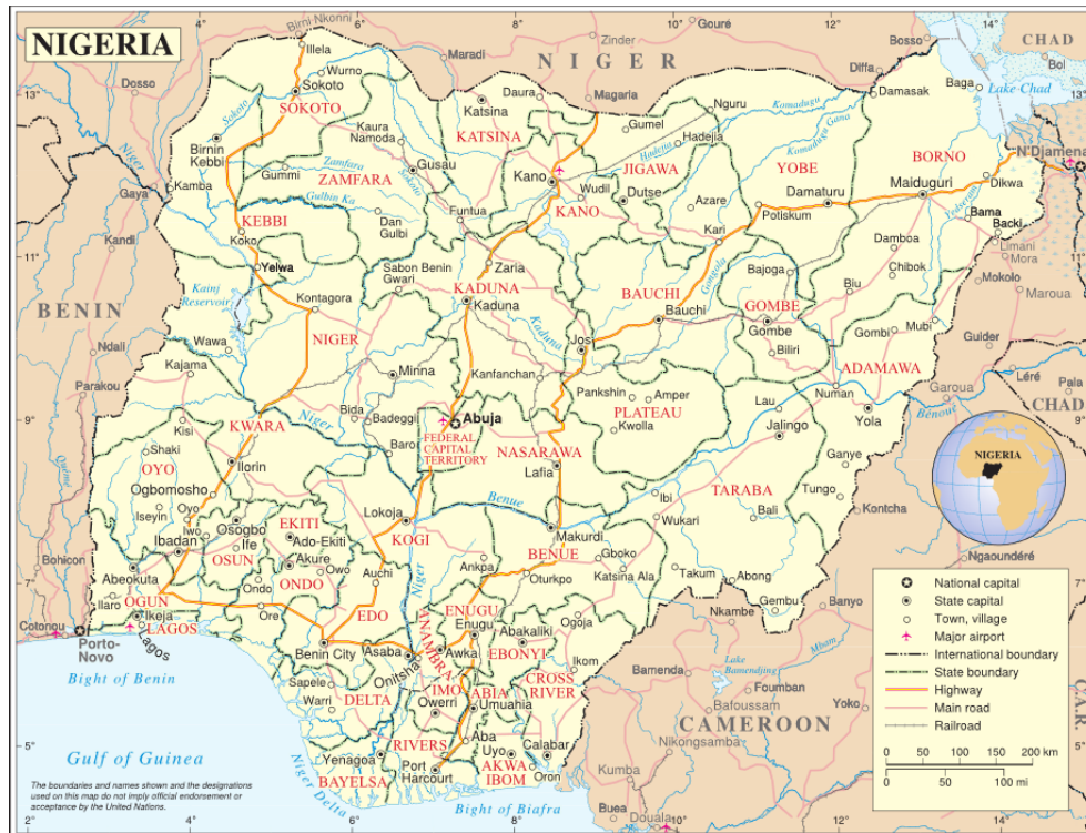
Karta B: Nigeria (med delstater och Federal Capital Territory (FCT) utmärkt). 19

Den federala statsmakten vägrade att godkänna bildandet av Biafra och i juli 1967 inleddes konfrontation mellan federala styrkor och Biafras trupper. 20 Enligt Radio France Internationale (RFI) fick Biafrasidan diskret stöd av Frankrike i form av utrustning och manskap (bl. a. legosoldater), utan att erhålla ett officiellt erkännande av Biafras självständighet. Även Kina, Portugal, Elfenbenskusten, Tanzania, Gabon och Zambia gav utbrytarna sitt understöd. Den federala sidan fick militärt stöd av Storbritannien, Sovjetunionen och USA. 21