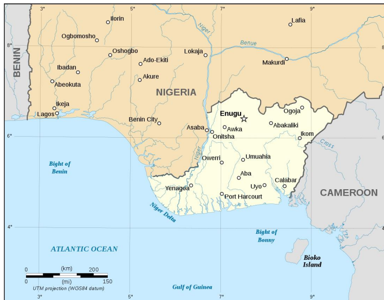
Karta A: Utbrytarrepubliken Biafra i maj 1967 [ungefärlig utbredning]. 2

I mitten av 1960-talet karaktäriserades samhällslivet i Nigeria av ekonomisk och politisk instabilitet samt etniska spänningar. 3 Mindre etniska grupper fruktade att bli dominerade av de tre stora – hausa-fulani, yoruba och igboer (iboer) – och bland de senare var spänningen särskilt stark mellan de muslimska hausa-fulani och de kristna igboerna. 4 I landets norra delar, dominerade av hausa-fulani, grodde bitterhet gentemot den mer välbärgade och utbildade igbo-minoriteten. 5 Nigeria var vid denna tid indelat i tre administrativa regioner: Norra, Södra respektive Östra regionen. 6