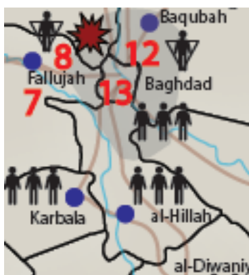
Iraq Situation Report: February 23-29, 2016 (détail) 69

L'Institute for the Study of War attribue également la bordure méridionale de la province de Bagdad à la province de Babil, comme on peut le voir sur les cartes qu'il propose :