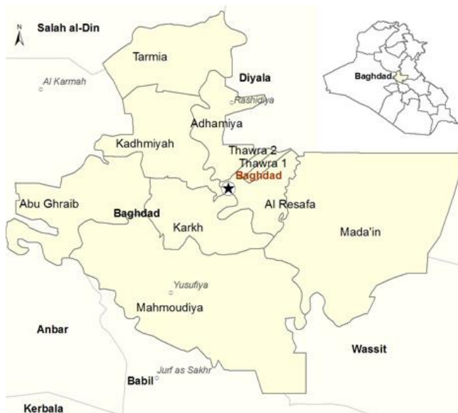
Joint Analysis and Policy Unit, (JAPU), Baghdad Governorate Profile, March 2016 67

Iraq Body Count utilise un système « hybride », dans le cadre duquel un incident peut être simultanément porté au compte des deux provinces. Cette ONG attribue en premier lieu les trois villes précitées à la province de Babil, et seulement en deuxième instance à la province de Bagdad 68 .