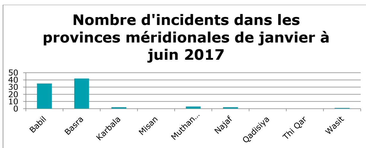
Nombre d'incidents dans le sud de l'Irak, de janvier à juin 2017 55

Le graphique suivant montre les incidents enregistrés par la même source, uniquement pour les provinces méridionales durant la même période. Il ressort que les violences sont concentrées dans les provinces de Babil et de Bassora. Parmi les 85 incidents enregistrés dans le sud de l'Irak par Musings on Iraq, 77 ont eu lieu dans ces deux provinces: