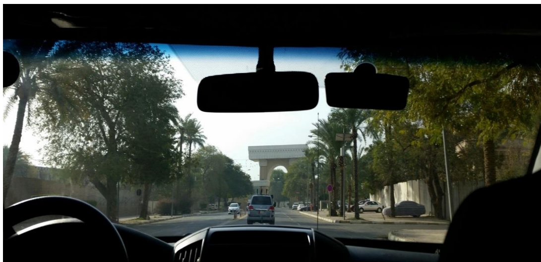
En elegant aveny flankert av betongmurer til vern mot angrep.

godt oppbud av soldater eller politi. Mange gater er flankert av 3-4 meter høye betongmurer til vern mot eksplosjoner. Murene gir et dystert inntrykk og sperrer iblant utsikten til ellers vakre bygg og parkanlegg.