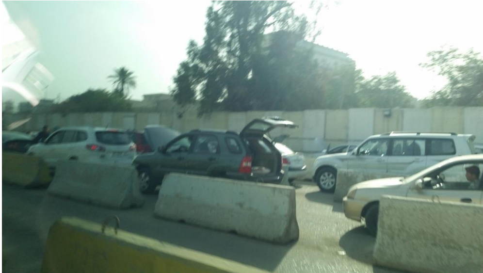
Kø på sjekkpunktet.

Myndighetene ser ifølge bl.a. Amnesty International (2016, s. 55) ut til kollektivt å betrakte sunnimuslimene som potensielt tilknyttet IS, eller som å støtte dem. Ifølge UNHCR (2017, s. 4) skal de statlige sikkerhetsorganene særlig tillegge sunniarabiske internflyktninger som søker om å få bosette seg i Bagdad, eller som allerede er bosatt der men ønsker å flytte innen byens grenser, IS-sympati eller -tilknytning. En kan da bli nektet adgang og/eller bosettingstillatelse (UNHCR 2017, s. 3). Grunnlaget for tillatelse vil dermed kunne sies å virke diskriminerende, ifølge UNHCR (2016a, s. 10).