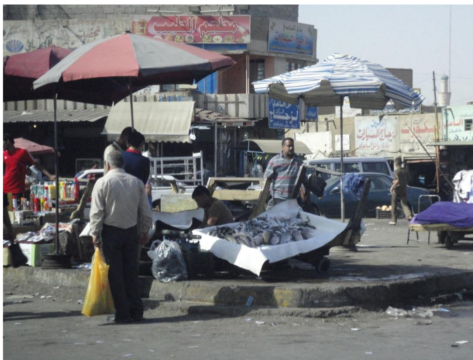
Marked i Bagdad.