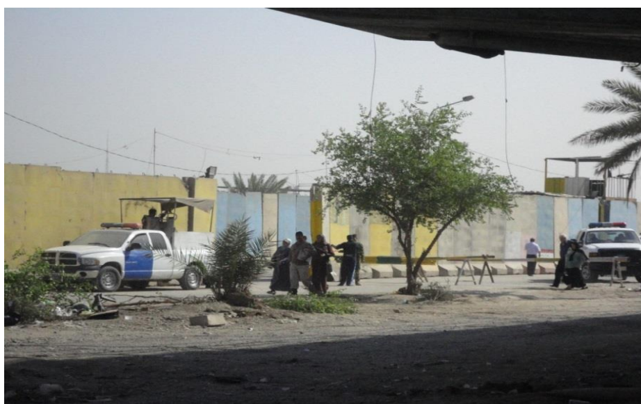
Vaktposter og sivile.

Samlet gir det hele inntrykk av en by i høy beredskap, der det sivile livet samtidig beveger seg som best det kan mellom alle de fysiske hindringene og de militære stillingene. Til sammen skaper det et bilde av en særegen «normalitet» som byen gjennom de siste 14 års uro har vennet seg til.