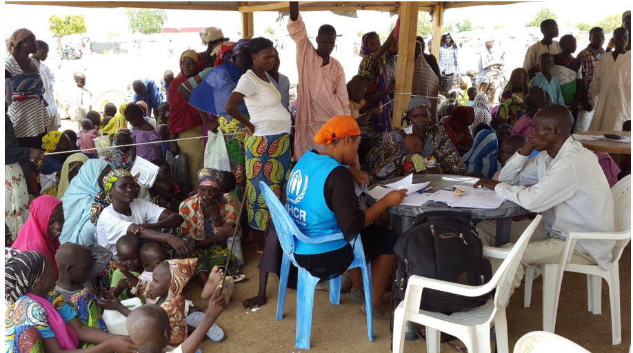
Enregistrement des réfugiés arrivés spontanément au camp de Minawao.