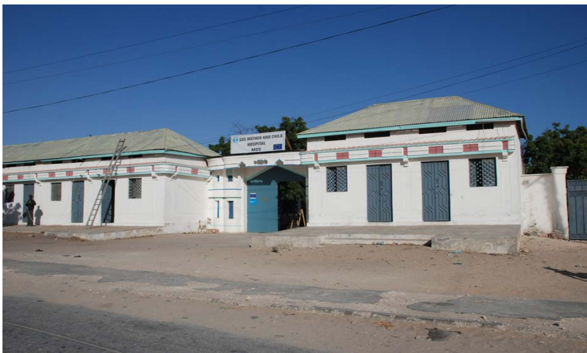
Mødre- og barnklinikk i en av Mogadishus bydeler

De kirurgiske inngrepene som foretas på sykehusene i Mogadishu, er keisersnitt, behandling av skuddsår, brokk, samt mave/tarmproblemer på grunn av tuberkulose eller innvollsormer, blindtarm eller keisersnitt. UNHCR opplyste for øvrig i samtale med Landinfo i Mogadishu i november 2013, at det hadde blitt stadig vanskeligere for somaliere å få visum til Kenya for medisinsk behandling. Som eksempel på dette omtalte UNHCR en hendelse i oktober 2013 da et barn døde fordi familien ikke fikk visum til Kenya i tide (intervju i Mogadishu, 12. november 2013).