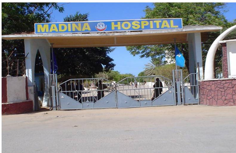
Madina-sykehuset i bydelen Madina i Mogadishu.

Standarden ved sykehusene varierer. Shifa-sykehuset i Mogadishu, som drives av den tyrkiske organisasjonen Doctors Worldwide Turkey, anses å ha god standard. Det samme gjelder Zam Zam-sykehuset som drives av en annen tyrkisk hjelpeorganisasjon; Humanitarian Relief Foundation, IHH. Ved Zam Zam utføres forøvrig grå stær-operasjoner. Digfer-sykehuset i Mogadishu, som er rehabilitert med tyrkisk bistand, skal etter planen åpnes i april 2015 (Republic of Turkey. Ministry of Foreign Affairs 2014). Dette skal være et moderne sykehus som kan tilby avansert behandling, men vil etter alt å dømme bli et tilbud for dem som kan betale (intervju i Mogadishu 15. november 2013).