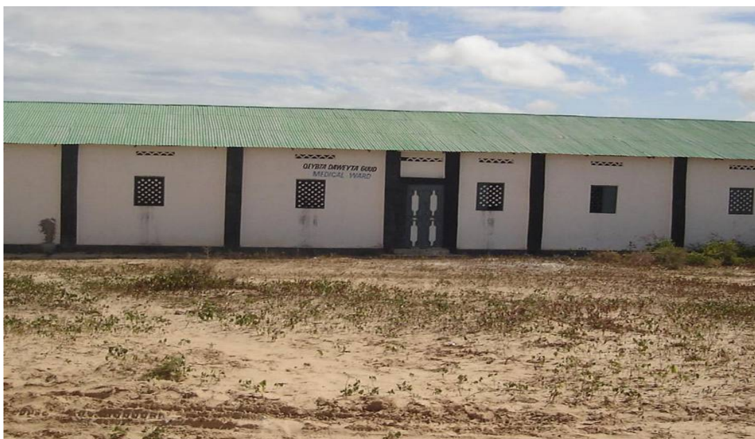
Daynile sykehus i bydelen Daynile i Mogadishu.

Det finnes åtte henvisningssykehus, ti regionale sykehus og 26 distriktssykehus i Sør-Somalia, men ingen av dem kan tilby spesialisttjenester av betydning. Det er dessuten 198 helsesentre/mødre-barn-klinikker som tilbyr basistjenester. I tillegg finnes det 269 helsestasjoner som skal kunne gi et minimumstilbud for lokalbefolkningen, men mange av dem er ikke operative (Ministry of Human Development and Public Services. Directorate of Health u.å., s. 21).