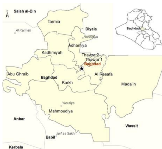
Province de Bagdad 2

Ce COI Focus a pour ambition de présenter un tableau général de la violence dans la province de Bagdad, qui comprend la capitale irakienne et ses alentours, notamment Mahmoudiyah, Tarmia, Mada'in et Abu Ghraib 1 .