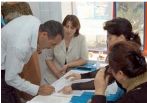
Eintragung in die Wählerliste.

Im Wahllokal erfolgt an einem Tisch die Überprüfung der Wahlberechtigung anhand von Wählerlisten. Ferner erfolgt normalerweise eine Prüfung mit einem Prüfgerät, ob der Wähler nicht bereits gewählt hat und deshalb als Wähler chemisch mit einer unsichtbaren Tinte gekennzeichnet ist. Ferner erfolgt die chemische Fingerkennzeichnung mit einer unsichtbaren Tinte.