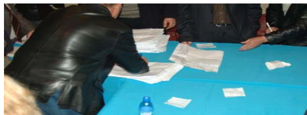
Ausleeren der Wahlurne und auszählen (Privatphotos).