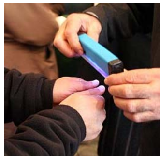
Eine Fingermarkierungsprüfung (Privatphoto).