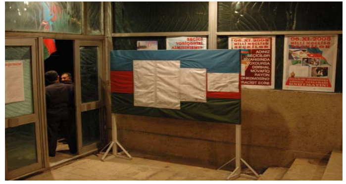
Eingangsbereich zu einem Wahllokal.