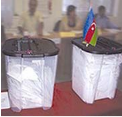
Wahlurnen (Photo Pakflett, des Herstellers der Urnen).

Hierauf begibt sich der Wähler zu einer durchsichtigen Wahlurne und wirft seinen Stimmzettel ein. Die Wahlbeobachter saßen meistens unweit der Wahlurne auf vorbereiteten Sitzgelegenheiten, hatten von dort aus aber regelmäßig auch einen guten Blick auf das gesamte Geschehen im Wahllokal. Es gab wohl 7.500 Wahlurnen und zusätzlich 5.000 mobile Wahlurnen.