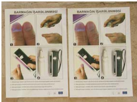
Amtliche Wahlplakate, die Fingermarkierung und -überprüfung erläuternd.