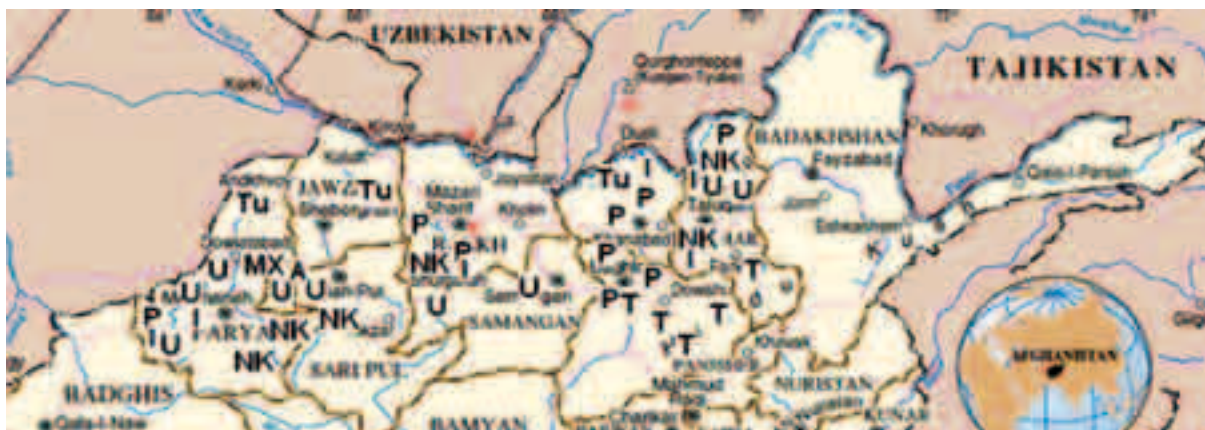
Illustration 4 — Composition ethnique des fronts talibans connus dans le Nord