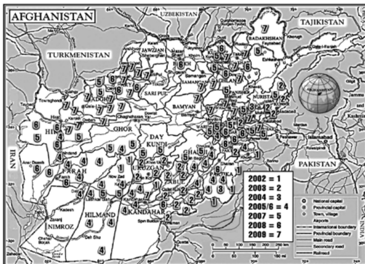
Illustration 3 — L'expansion de l'insurrection

Les talibans se réorganisent et se lancent dans une insurrection contre le gouvernement. Les bombes artisanales, les attentats et les exécutions ciblées déstabilisent certaines régions du pays. Le gouvernement Karzai fait alliance avec les anciens chefs de guerre et commandants. Les accords de Bonn ne contiennent aucune disposition sur le désarmement des combattants. La situation problématique, provoquée par la fragmentation du pouvoir et la présence des commandants, des chefs de guerre et des hommes forts, une situation qui perturbe l'Afghanistan depuis plus de deux décennies, est toujours bien présente. Une Loya Jirga est organisée et ce conseil adopte une Constitution afghane en janvier 2004, mais les initiatives de construction de l'État progressent lentement et l'influence du gouvernement reste limitée à la capitale, où sont stationnées les seules forces internationales. La