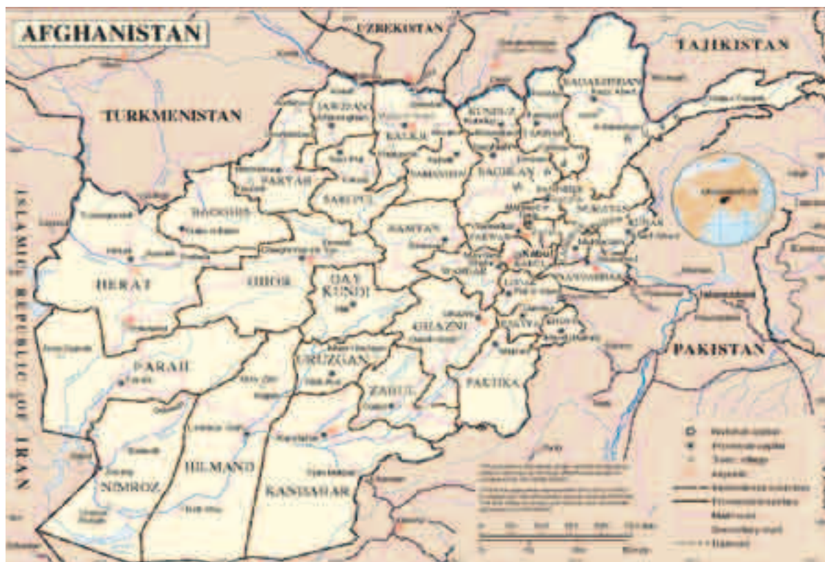
Illustration 2 — Provinces d'Afghanistan

Certains commandants ouzbeks et tadjiks rejoignent le commandant moudjahidine Ahmad Shah Massoud, qui n'est autre que le commandant militaire du Jamiat-e-Islami, dirigé par Burhanuddin Rabbani. Massoud arrive à Kaboul en 1992. Un gouvernement est formé et Rabbani accède à la présidence, succédant à Mojaddedi, qui n'y sera resté que quelques mois. Gulbuddin Hekmatyar, un leader de l'opposition, est l'un des principaux concurrents du gouvernement. Il ne compte pas de véritables sympathisants parmi les communautés afghanes, mais ses relations internationales lui assurent de nombreuses ressources. Les hommes forts régionaux ont des sympathisants parmi