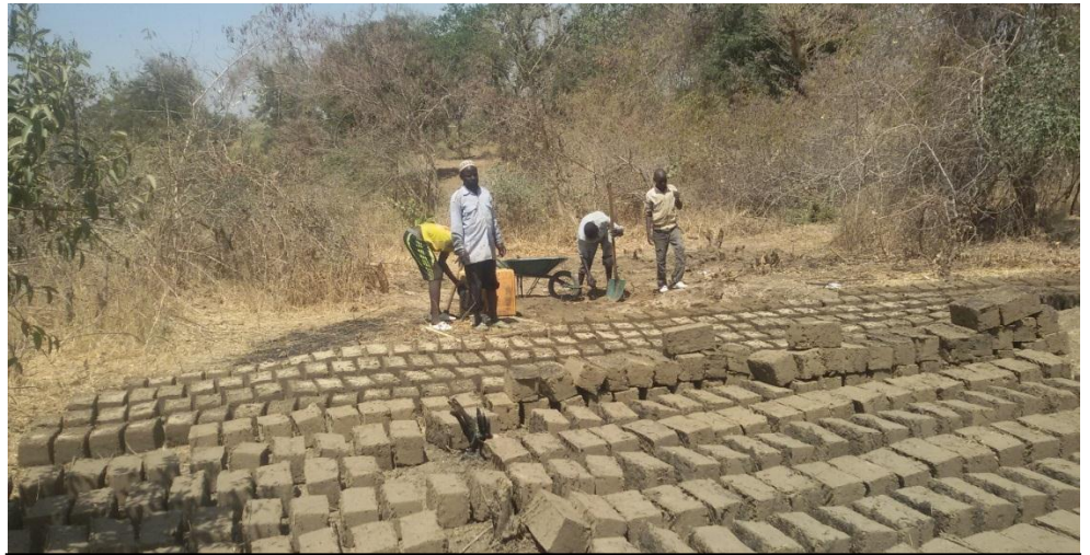
Fabrication de briques adobes par une famille déplacée de Zamaï en vue de la construction de leur abri